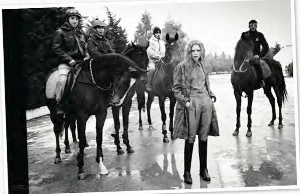
I SNÖSTORMEN. Så här blev resultatet av uppdraget för Baku Magazine i Azerbajdzjan. Jockeys och hästar från gården. Läs om bakgrunden här intill.

– Jag tror aldrig jag överger Berlin, men min dröm är att hitta ett torp på landet. Kanske till och med uppe i Norrland. Inget kan slå den fantastiska norrländska naturen!