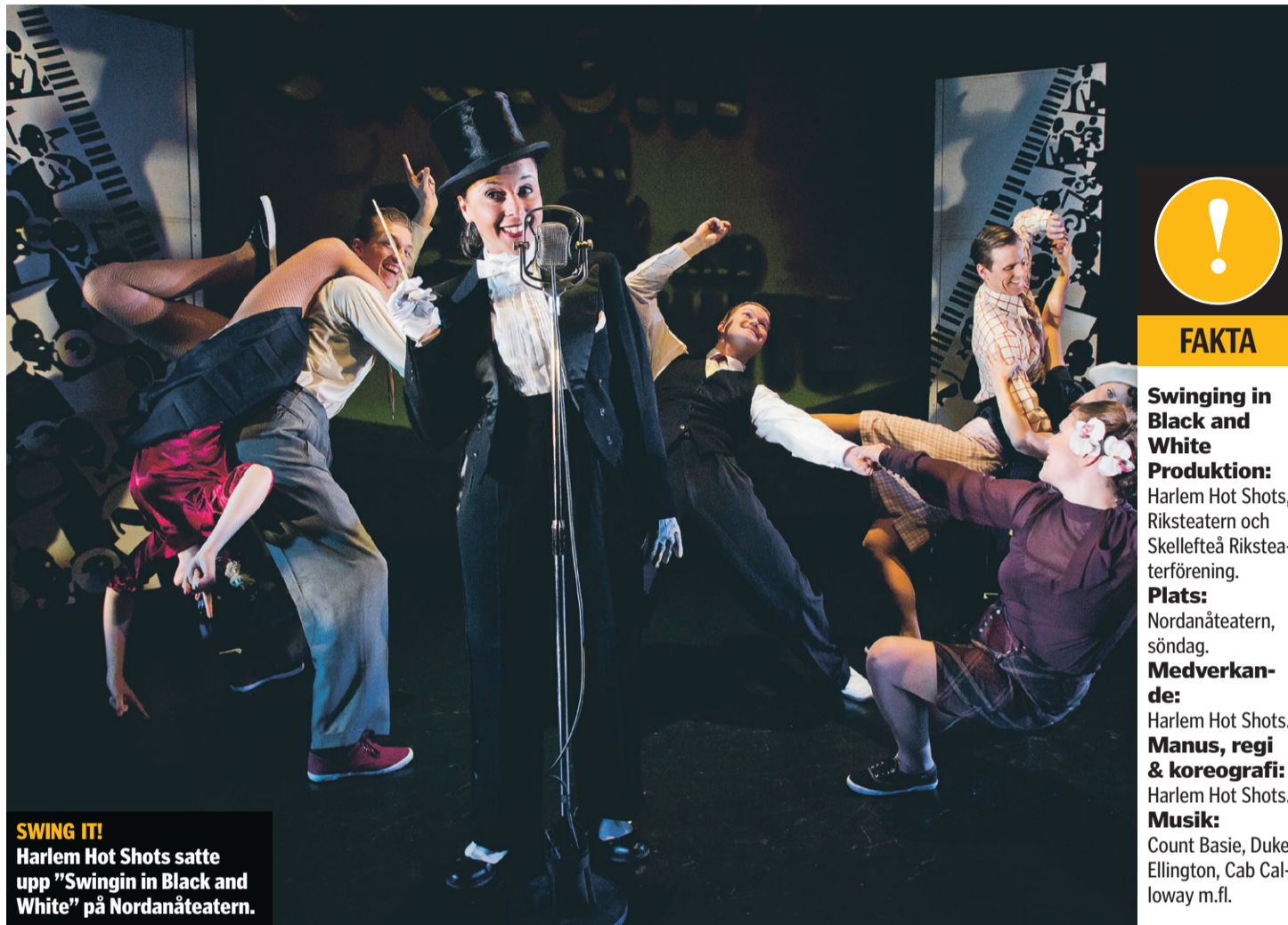
SWING IT! Harlem Hot Shots satte upp "Swingin in Black and White" på Nordanåteatern.